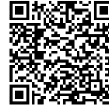
Geld und Geldpolitik