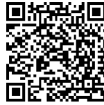
Wie Wirtschaft funktioniert