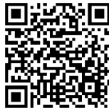
Wirtschaft heute (derzeit nicht verfügbar)